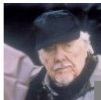
ロバート・アルトマン監督 Robert Altman (1925-2006)